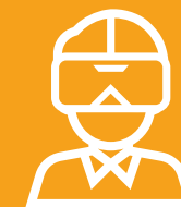
A/R, V/R e Mixed Reality