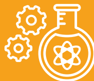
STEAM e Robotica